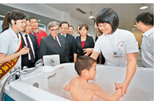
在馬會的捐助下，四川省八一康復中心得以購置先進的康復設備和器材，包括圖中的水療設備。

除了匡扶社群，改善香港市民的生活質素外，每當國家遭逢天災，馬會均即時作出緊急捐款，並發起籌款活動。2008年，國家民政部向馬會頒發「中華慈善獎」特別貢獻獎，表揚馬會在慈善方面的功績。