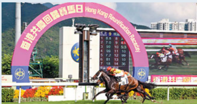
馬會去年首次舉辦香港共慶回歸賽馬日，與市民一同慶祝特區生日。

今年的賽事將於7月11日假沙田馬場再次舉行，除「香港回歸盃」外，同日上演由香港中華廠商聯合會贊助的「廠商會工展慶回歸紀念盃」，以及向區議會和地區組織等馬會夥伴致意的第5屆「十八區盃」。屆時，馬會將於場內舉行多項慶祝活動和精彩表演，讓進場觀賽的市民及遊客，盡情投入慶祝香港回歸後「馬照跑」。