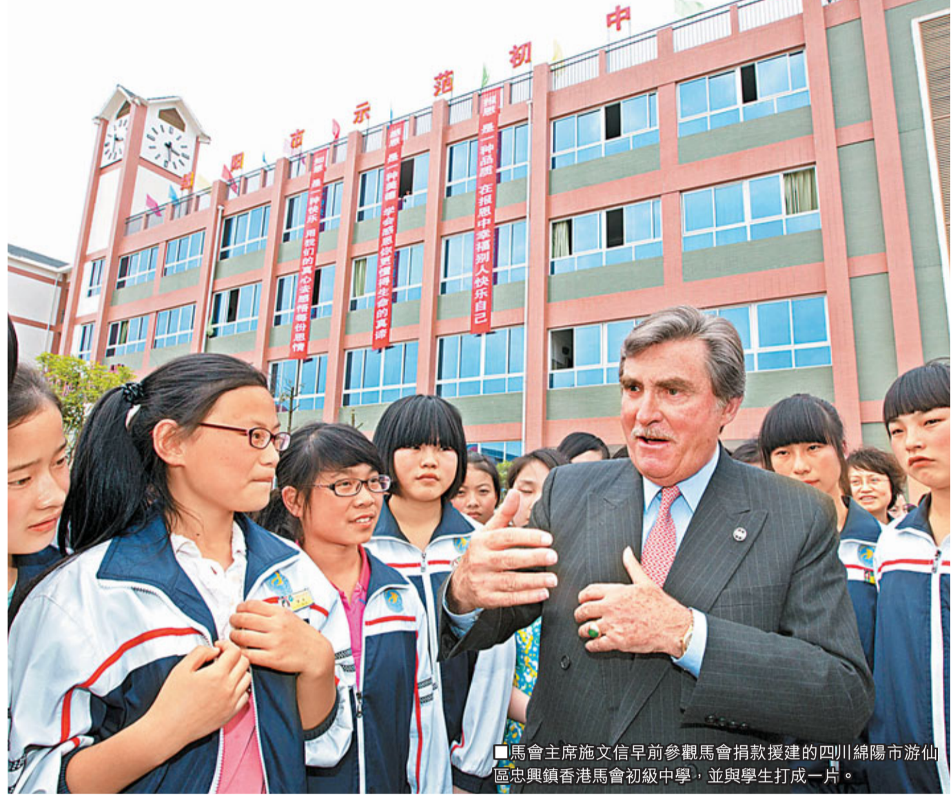
馬會主席施文信早前參觀馬會捐款援建的四川綿陽市游仙區忠興鎮香港馬會初級中學，並與學生打成一片。

還有個多星期，香港回歸祖國的懷抱15年。這些年來，馬會與港人共同見證「一國兩制」的落實，回歸後「馬照跑」，原有生活模式不變。這不單展現於香港賽馬水平日漸提高，躋身世界馬壇重要地位；更重要意義，是馬會得以繼續透過獨特的非牟利營運模式，將所得盈餘撥捐公益慈善。一脈相連，馬會行善的足跡亦走得更遠更廣，15年來與內地同胞和香港市民手牽手、心連心，共度金融風暴、沙士疫症、無情天災等衝擊，更協助國家在奧運會和亞運會兩大國際體壇盛事上，創造輝煌歷史。