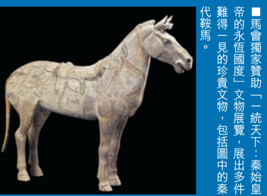
馬會獨家贊助「一統天下：秦始皇的永恆國度」文物展覽，展出多件難得一見的珍貴文物，包括圖中的秦代鞍馬。

近日，馬會的7個援建項目陸續落成，包括開創體教結合教學模式，致力培養新一代智慧型體育精英的四川香港馬會奧林匹克運動學校。馬會主席施文信在主持該校的開幕禮時表示：「奧林匹克運動學校不單填補了受災運動設施所遺留下的空白，更是最富創意和極具想像力的項目，在這裡將會培育出文化科學知識與體育才能兼備的精英人才，為他們日後發展提供