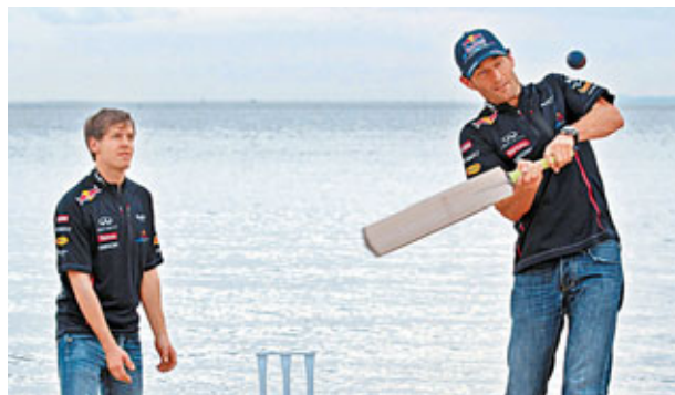
板球被譽為是英國的貴族運動。

也喜歡騎馬顯身手。安妮公主曾以馬術員身份參加一九七六年的蒙特利爾奧運會，今年她的女兒扎拉將出賽倫敦奧運。