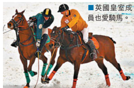
英國皇室成員也愛騎馬。

死神威脅，英政府要減輕醫療衛生開銷，鼓勵年輕人參與運動，已撥巨款增建運動設施。例如，計劃在各社區興建五十個公眾泳池前，先在學校禮堂豎立流動吹氣泳池，供學生體育堂使用。另外，在公