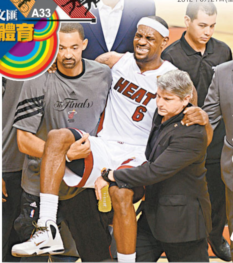
占士退下火線。法新社