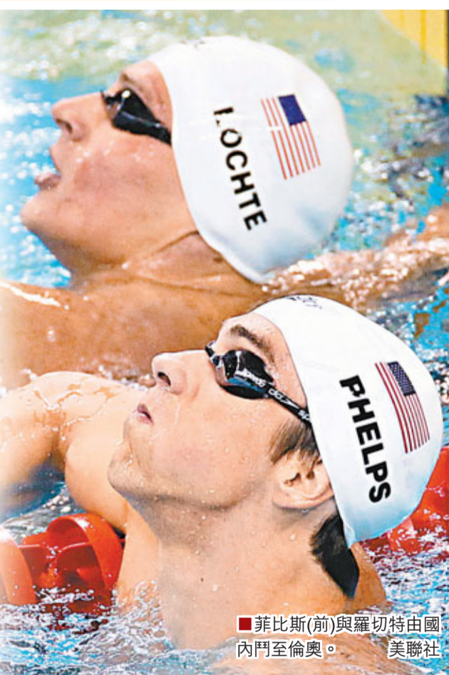
菲比斯(前)與羅切特由國內門至倫奧。