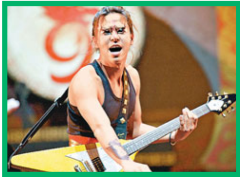
電影中柯有倫也一展歌喉。