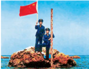
■菲律賓媒體所刊發的照片。網上圖片

使館強調，黃岩島是中國固有領土，有關照片再次證明黃岩島是中國領土，中國長期以來對黃岩島實行有效管轄。