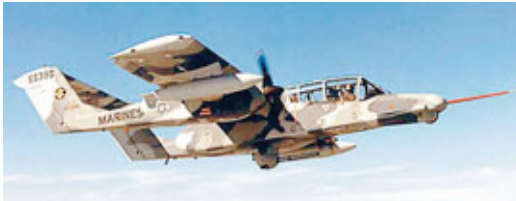
■菲律賓在南海的主力OV-10飛機。

專家觀點：種子上天走一遭，只是「太空升級」第一步。回來的種子至少要經過三四代的篩選，然後到多個省份去試種；試種成功，再拿到品種審定委員會去審定。品種委員會還要試種三年，如果三年的表現都超過對照品種，才能夠得到審定證書。