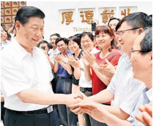
■20日，習近平在清華大學考察時與師生們交談。

20日上午，習近平在清華大學主持召開高校黨建工作座談會，強調高校是重要的教育陣地，也是重要的思想文化陣地。各級黨委要牢牢把握社會主義大學的