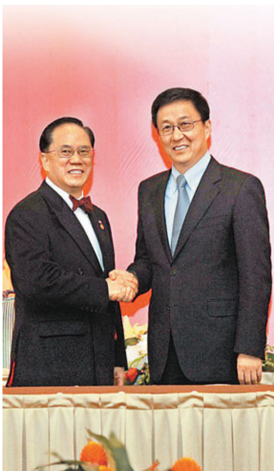
■行政長官曾蔭權(左)和上海市長韓正在滬港經貿合作會議第二次會議上握手。

被外界譽為中國經濟發展的「雙引擎」，滬港近年來不僅加強金融、航運方面的交流與合作，在教育醫療、旅遊會展、文化、創意及體育等各個領域，兩地亦展開了全方位的深化合作。