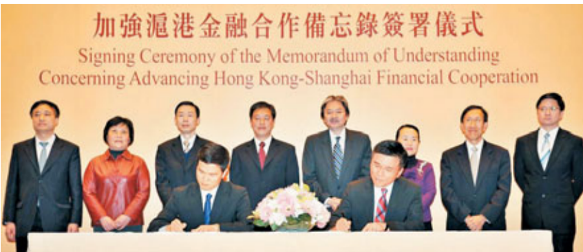
■財經事務及庫務局局長陳家強(前排右)與上海市金融服務辦公室主任方星海(前排左)簽署《關於加強滬港金融合作的備忘錄》。

「我們會藉着國家『十二五』規劃的契機，以及國務院副總理李克強去年公布30多項支持香港進一步發展的政策措施，繼續深化滬港經濟貿易合作，落實中央政府於『十二五』期末基本實現兩地服務貿易自由化的目標。」