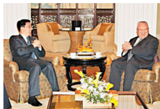
■2003年，前行政長官董建華(右)和上海市長韓正會談。

結構相似，發展目標相同，身為長三角和珠江三角洲兩地，非但沒有因此上演「爭食」的零和遊戲，反而不斷拓展合作的領域和空間：從2003年首次滬港經貿合作會議確定的金融服務、旅遊會展及人才交流等8個領域的交流，到2012年達成航空航運及物流、文化創意及體育、教育及醫療衛生等9個合作範疇。滬港經貿合作領域不斷擴大，聯繫日益緊密，相互依存度進一步提升。香港駐滬辦主任譚惠儀將滬港之間的合作秘訣歸納為十二字箴言：錯位發展、優勢互補、互利雙贏。正是這種錯位互補的合作模式，為滬港合作打開了廣闊的空間。