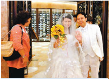
■新一代跨境家庭中，各自有事業成為平等重要的元素。

Nancy指以前生活中很少有港人或者香港親戚，更不會想過會嫁到香港。剛讀大學時接觸到香港同學，還一直覺得港人比較高傲，難以接近，但接觸多了，發現港男其實很nice也有禮貌。她笑指，男友第一次拜訪自己的父母時，不停說謝謝，令父母都有些不知所措。而懂得對女友體貼包容也讓阿鋒最終贏得女友心，Nancy笑說，自己一向小女人，男友卻比自己小一歲，剛開始很難接受，「但很多時候懂得照顧，也會包容，一點都不覺得比我小。」