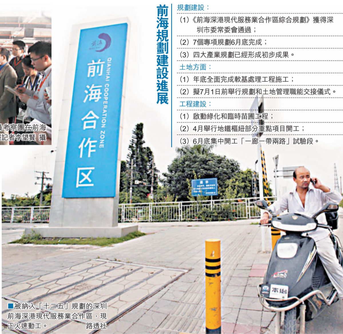
被納入「十二五」規劃的深圳前海深港現代服務業合作區，現正火速動工。

在香港回歸15周年之際，國務院或批准關於前海的系列先行先試優惠措施，作為惠港大禮的一部分。關於先行先試政策的內容，一直倍受外界關注。出席論壇的國家發改委地區經濟司處長張建民表示，政策將聚焦於服務前海的發展重點產業，包括金融、科技服務、信息服務以及其他專業服務等。且前海作為深港合作示範區，中央在研究政策時，充分考慮了香港政商界的意見。在保持前瞻性的同時，也須保持跟國家大方向一致。