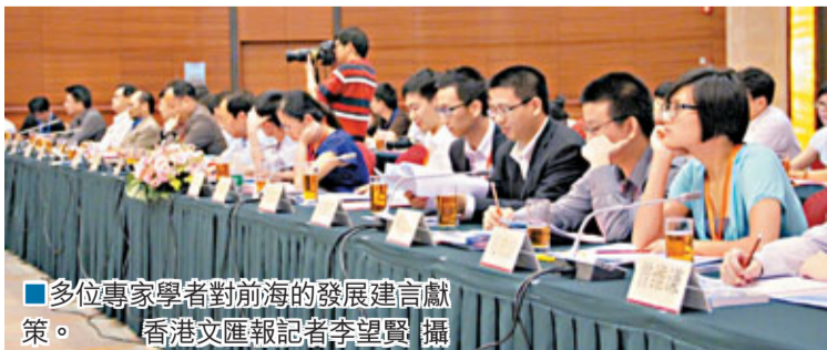
多位專家學者對前海的發展建言獻策。

資者通過設在前海的金融機構，以人民幣資金投資內地證券等等。」他認為，如果香港人民幣基金可以進入前海發展區新的投資管道，對香港建設人民幣離岸業務中心，無疑具有很大的推動作用，同時也有利於人民幣國際化的實施。