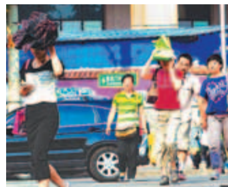
高溫天氣讓市民難以忍受。

中央氣象台首席預報員何立富表示，由於高空暖氣團的控制時間不會太長，所以，高溫天氣大概持續3至5天左右，預計今日之後，隨着高空暖氣團的東移，華北黃淮一帶的高溫天氣就會趨於緩和或緩解。明日之後，隨着大氣環流形勢的調整，華北等地的雷陣雨天氣又會逐漸多起來。