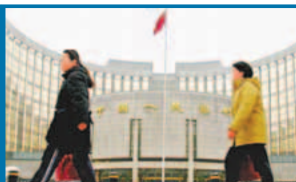
央行19日發佈的第二季度儲戶問卷的調查顯示，居民收入信心指數創下1999年來的最低水平。