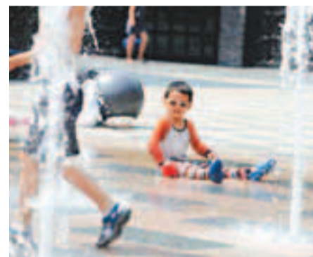
17日，北京迎來入夏後最熱一天。圖為北京三里屯，中外遊人嬉水納涼。