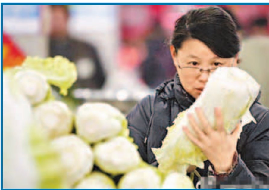
物價高企，讓不少市民倍感壓力。