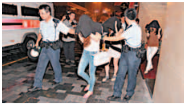
■報稱在酒店遇劫內地女子事後與同房兩名女子去警署助查。

據案情顯示，歐文龍涉嫌於2005年期間收取了劉鑾雄及羅傑承給予的2,000萬港元賄款，利用職權承批偉龍馬路5幅土地(澳門國際機場對面)出售予二人，該5幅土地亦正被華人置業建設成據稱投資已超200億港元的高檔住宅項目——「御海·南灣」，據知該項目現已預售逾300個單位，若澳門特區政府真收回涉案的5幅地皮，估計華置亦將因此而損失逾百億元。此外，涉嫌賄賂歐文龍的「大劉」及羅傑承亦被澳門法院列為另案之嫌犯，不日在澳門初級法院庭審。