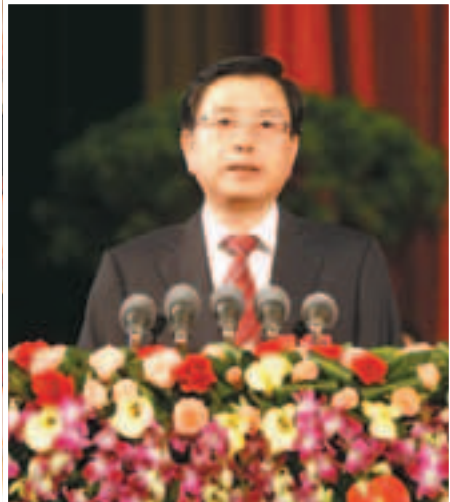
■張德江在大會報告中強調了民主法制建設。

就外界廣泛關注的「薄、王事件」，張德江也不諱言。他表示，此事件給黨和國家形象帶來很大損害，給重慶改革發展造成嚴重影響。重慶市委先後召開常委會會議