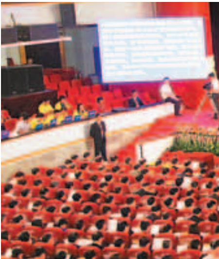
■中共重慶市第四次代表大會，是張德江出任重慶市委書記以來該市召開的規模最大的會議。

和常委專題民主生活會，認真學習貫徹中央指示精神，並進行了總結反思。大家認為，一方面，要把重慶近5年取得的成績和廣大幹部群眾付出的艱辛努力與王立軍事件、尼爾·伍德死亡案件和薄熙來嚴重違紀問題嚴格區分開來；另一方面，要深刻汲取教訓，認真查找工作中的問題，切實改進工作。他強調要同黨中央保持一致，以「科學發展、富民興渝」為總任務，着