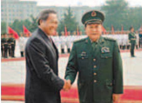
■梁光烈(右)歡迎來訪的新加坡國防部長黃永宏。

另據報道，17日，胡錦濤在洛斯卡沃斯分別會見了墨西哥總統卡爾德龍和埃塞俄比亞總理梅萊斯。