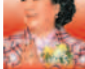
■朱蓮芬 全國政協委員 BBS太平紳士

蟬鳴荔熟，夏日荷香。我們懷着喜悅心情迎接香港回歸祖國十五周年。為慶祝此值得紀念的日子，香港工商專業協進會、香港文化教育交流協進會（籌委會）及SINO Dynamic Solutions Limited聯合舉辦「香港移動程式APPSANITY 2012」比賽，目的是鼓勵創意發揮，希望有志之士在這個經濟艱難的時期，仍能為自己打拚及闖出一番事業。比賽以「3創」：「創新科技、創新思維、創造就業」為主題，由主辦單位提供免費的香港技術平台（SDK）予參賽者設計移動程式，藉此促進全港及境外手機移動程式創新構思及專業開發水平，是一項創新又有意義的比賽。