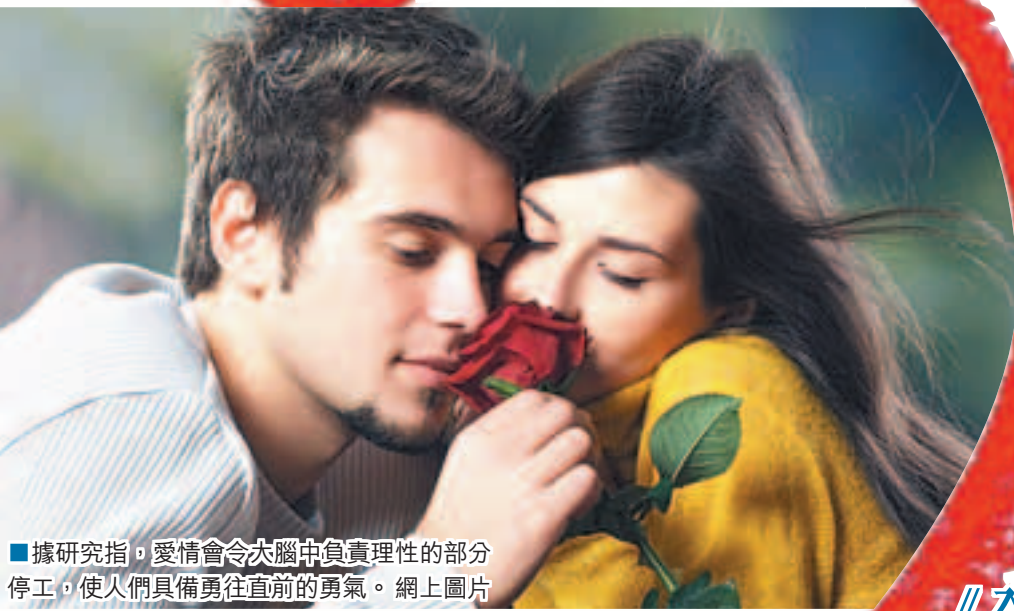
■據研究指，愛情會令大腦中負責理性的部分停工，使人們具備勇往直前的勇氣。