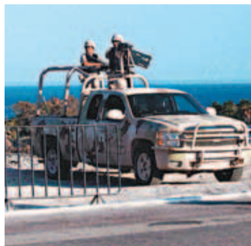
在各國代表團從機場到下榻酒店途中，墨西哥軍方派出的安力量嚴陣以待，確保與會元首的安全。

本次洛斯卡沃斯峰會將於18日至19日舉行，重點討論世界經濟形勢、加強國際金融體系、發展問題、貿易問題、就業問題等議題。