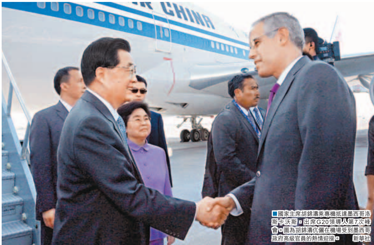
國家主席胡錦濤乘專機抵達墨西哥洛斯卡沃斯，出席G20領導人第7次峰會。圖為胡錦濤在機場受到墨西哥政府高級官員的熱情迎接。

香港文匯報訊 據新華社報道，國家主席胡錦濤在墨西哥出席二十國集團(G20)領導人第7次峰會前夕接受墨西哥主流媒體書面採訪時表示，全球經濟開始復甦，但存在不穩定因素；對歐洲主權債務等各方普遍關注的問題，G20要以建設性和合作性的方式予以討論，鼓勵並支持歐方有關努力，共同向市場傳遞信心。同時，胡錦濤又提到中國經濟形勢，表示會繼續實施積極的財政政策和穩健的貨幣政策。