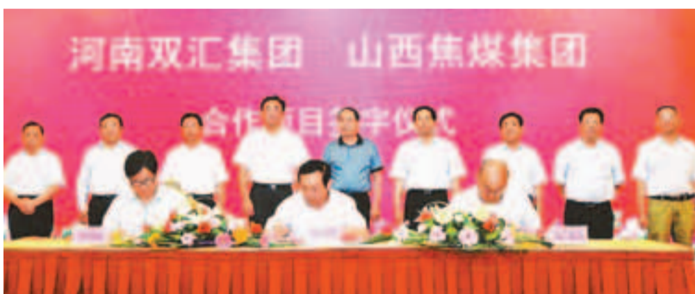
雙匯集團與山西焦煤集團合作項目簽字儀式在河南省鄭州市舉行。

香港文匯報訊(記者 芮桂穩 鄭州報道)雙匯集團與山西焦煤集團合作項目簽字儀式日前在河南省鄭州市舉行。根據合作協議聲明，雙方將在太原市陽曲縣開工建設生豬屠宰加工項目，計劃年屠宰生豬200萬頭，加工肉製品10萬噸，銷售額將達30億元(人民幣，下同)至40億元，項目力爭一年內建成投產。