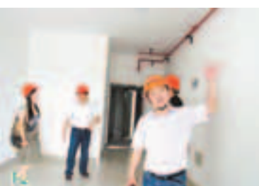
工作人員介紹天門湖三號樓內部裝修情況。

房為公寓式，樓高18層，包括374套住宅，將提供給開發區企業的藍領工人等居民入住。這棟住宅去年8月開工，今年5月封頂，現正進行裝修，今年底可交付使用，實現「拎包入住」。這是合肥市第一棟採取住宅產業化模式建造的住房，樓房採取裝配式結構，使用西偉德公司自動化流水線生產的樓板、牆板和樓梯部件，抗震烈度為7度。