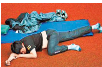
綠委在「立院」挑燈夜戰，睡姿醜態成為傳媒焦點。

據中通社15日電 花蓮一夜不平靜，自15日凌晨零時15分開始到5時12分止，相連發生26起有感地震，最大震度是在東海岸的磯崎有6級，花蓮市區也有4級，花蓮縣消防局派員至各地巡邏，所幸只有11線36公里處有零星落石，花蓮工務段已排除落石，沒有災情傳出。 有夜宿飯店的旅客嚇得急忙逃出，站在馬路邊不敢進房；一些在外租屋的大學生，索性約同學到麥當勞吃宵夜，遇到接二連三的地震，有人餘悸說，「一路亂搖，乾脆別睡，約朋友聊到天亮躲地震！」