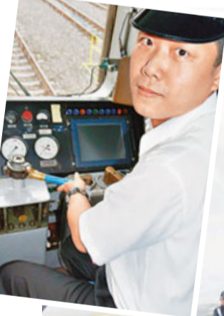
自強號脫軌後，機警的司機(見小圖)將列車往山壁方向傾斜，免於掉到太平洋。