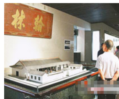
中國書院博物館一隅。

據了解，這座耗時近十年籌備的中國書院博物館陳列館，總投資5000餘萬元人民幣。館內5個主體展廳集中展示書院千年發展歷程，及其教育、學術、祭祀、藏書刻書等功能，大量收藏各地書院的書院志、古籍、碑