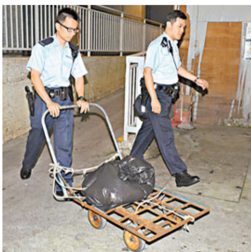
■警員將涉運載赤裸婦人的手推車及衣物檢走。