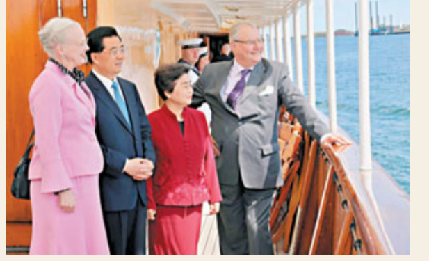
中國國家主席胡錦濤夫婦在丹麥女王瑪格麗特二世夫婦陪同下考察參觀首都哥本哈根的綠色發展。

香港文匯報訊 綜合新華社、中新社報道，中國國家主席胡錦濤和夫人劉永清當地時間15日上午在哥本哈根會見丹麥女王瑪格麗特二世和丈夫亨利克親王，雙方進行了親切友好的交談。 胡錦濤高度讚賞瑪格麗特二世及丹麥王室為增進中丹友誼作出重要貢獻。 胡錦濤表示，中國和丹麥雖然相距遙遠，但兩國人民有著長期友好交往的歷史。中國重視同丹麥的關係，願在相互尊重、平等互利的基礎上，擴大友好交流合作，推動中丹全面戰略夥伴關係不斷向前發展。 胡錦濤表示，文化交流是兩國人民加深相互了解的重要紐帶。近年來，中丹文化交流活躍，希望雙方共同努力，推動中丹文化交流進一步深化。 瑪格麗特二世和亨利克親王愉快地憶及1979年對中國的訪問。他們表示，自那以後，中國發展日新月異，取得了不起的成就，中丹關係也有長足進展。特別是2008年雙方建立全面戰略夥伴關係以來，兩國關係保持良好發展勢頭，丹麥人民對胡錦濤主席這次國事訪問熱烈歡迎並充滿期待，相信訪問必將加強兩國經貿、可持續發展等領域合作，推動中丹關係更好發展。 當晚，胡錦濤還出席了瑪格麗特二世舉行的歡迎宴會。 胡錦濤當口還在丹麥首都哥本哈根考察參觀這座城市的綠色發展。 據了解，訪問期間，胡錦濤將同丹麥首相托寧-施密特舉行會談，就進一步發展兩國全面戰略夥伴關係交換意見。