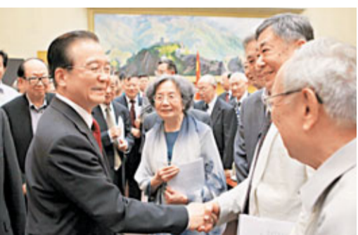
溫家寶與參事、館員親切握手交談。

積極推進政治體制改革 溫家寶說，推進決策民主化科學化，不僅是領導方法和工作作風問題，還涉及政治體制改革、加強民主政治建設問題。我們不僅要深化經濟體制改革，完善社會主義市場經濟體制；而且要積極穩妥地推進政治體制改革，大力發展社會主義民主政治。這兩個方面都很重要，體現了社會主義本質特徵的內在要求。中共十七大指出：要「加強公民意識教育，樹立社會