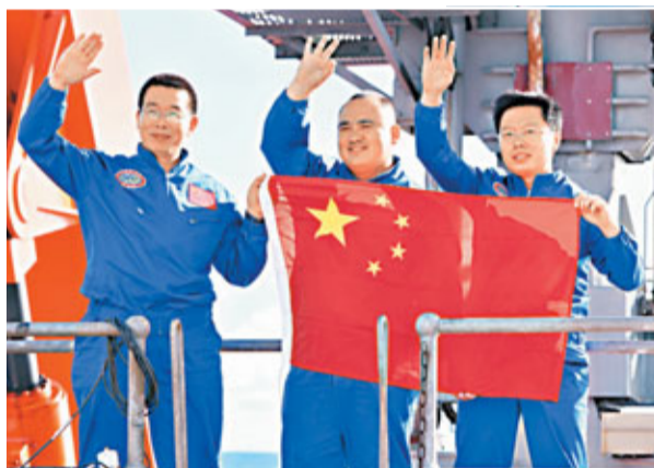
海試結束後，三名試航員手舉國旗致意。

香港文匯報訊 綜合新華社、中新社報道，中國載人深潛試驗再創歷史。北京時間6月15日下午2時許，中國自主研製的「蛟龍號」載人潛水器7,000米海試在西太平洋的馬里亞納海溝試驗區成功完成了第一次下潛試驗，經現場指揮部確認，最大下潛深度達6,671米，創造中國載人深潛新紀錄。