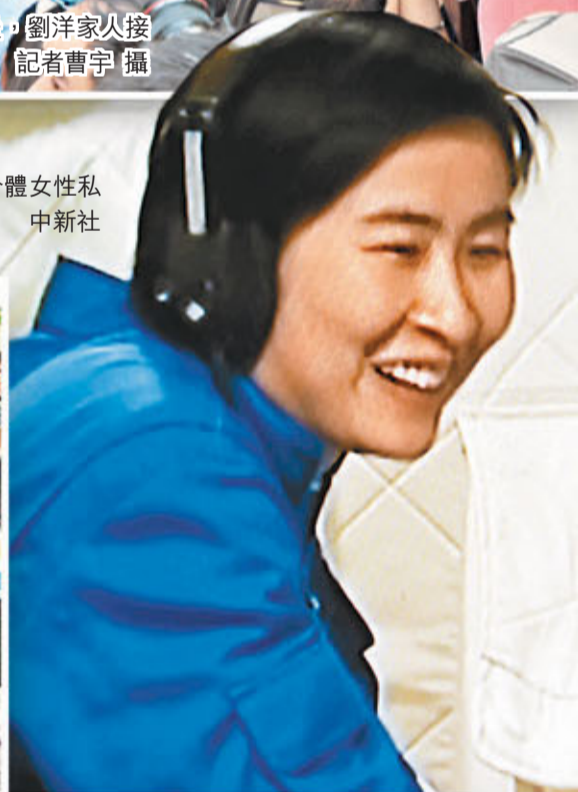
劉洋完成模擬組合體女性私密空間飛行演練。中新社