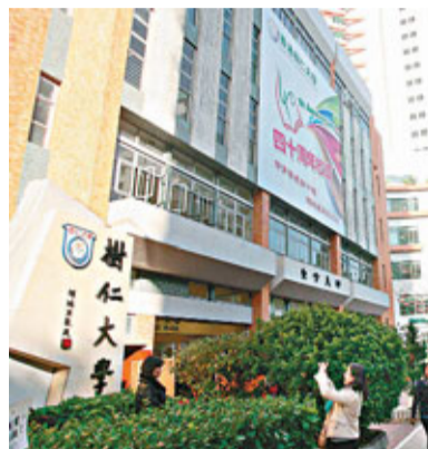
自資專上教育委員會在首次開會提及私立大學發展。圖為樹仁大學校舍。資料圖片