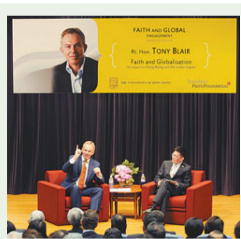
英國前首相貝理雅於香港大學演講，探討全球化及宗教信仰多元化發展趨勢。

雷又強調，教資會去年公布《高等教育檢討報告》，已明確提出8大院校需把自資營運社區書院和本部「分家」，讓賬目更分明，「分家是一定要做的，且是正確方向」，查賬有望更清楚區分兩方面財政資料，預計8大調查明年內完成。