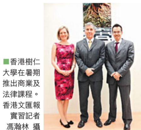
香港樹仁大學在暑期推出商業及法律課程。

香港文匯報訊(實習記者 馮瀚林)商業社會經常出現糾紛，以調解方法處理矛盾成勢所趨。有見及此，香港樹仁大學最近開設「調解員認證課程」，讓學生和公眾了解調解技巧。另隨着香港與內地接觸頻繁，仁大與中國政法大學港澳教育合作中心合辦中國政法大學第二學位，令學生兼備中國法律專業知識。