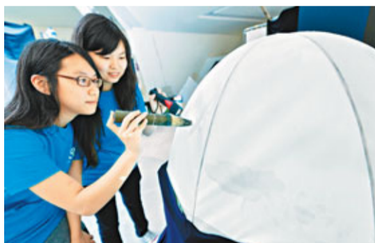
另一件作品「Playaniplay」為互動裝置，觀眾可揮動光筆，在虛擬空間創作國畫，畫板為該裝置表面，半球狀造型寓意「無窮無盡」。