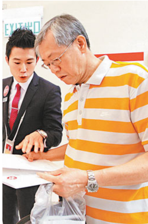
iBond昨日截止認購，反應火熱，初步錄超額認購4倍。

香港文匯報訊(記者 馬子豪)政府發行第二批iBond(4214)昨日截止認購，政府公布初步認購數據，是次發行額達100億元的iBond，共錄得約502億元總認購額，即超額認購4倍；而認購人數則較去年倍增至約33萬人，以iBond最多分派予100萬名投資者，認購3萬元以上的投資者最少可穩獲3手。