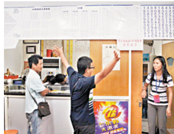
一位彩民在售出中獎彩票的投注站高舉雙手向工作人員表示祝賀。

據悉，這位5.7億元大獎的得主須繳納總獎金20%的稅款，繳稅額高達1億多元。根據內地《彩票管理條例》，彩票兌獎有效期為60天，也就是說，這位中獎者最後兌獎截止日期為8月11日。