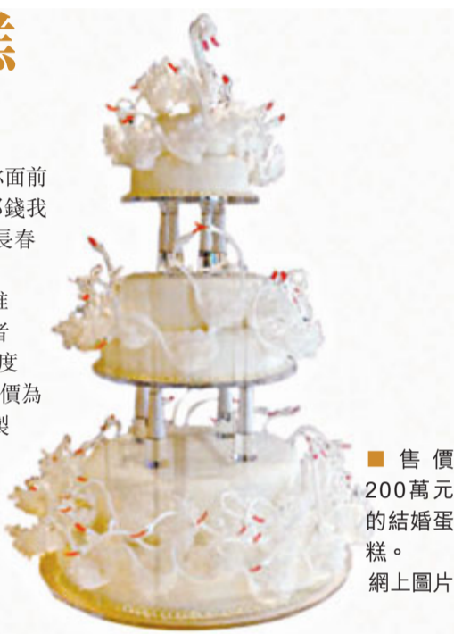
售價200萬元的結婚蛋糕。網上圖片