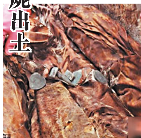
玉帶保存完好。

最讓人驚歎的是，隨著發掘的深入，考古專家鑒定，其中北側一棺木墓主人屍身保存完好，龍袍、玉帶等隨葬品保存完好，依據出土的龍袍、玉帶等推斷墓主是一名顯赫的王室後裔，係明代寧王的子孫，這對研究明代歷史提供了很有價值的實物佐證。 中國新聞網