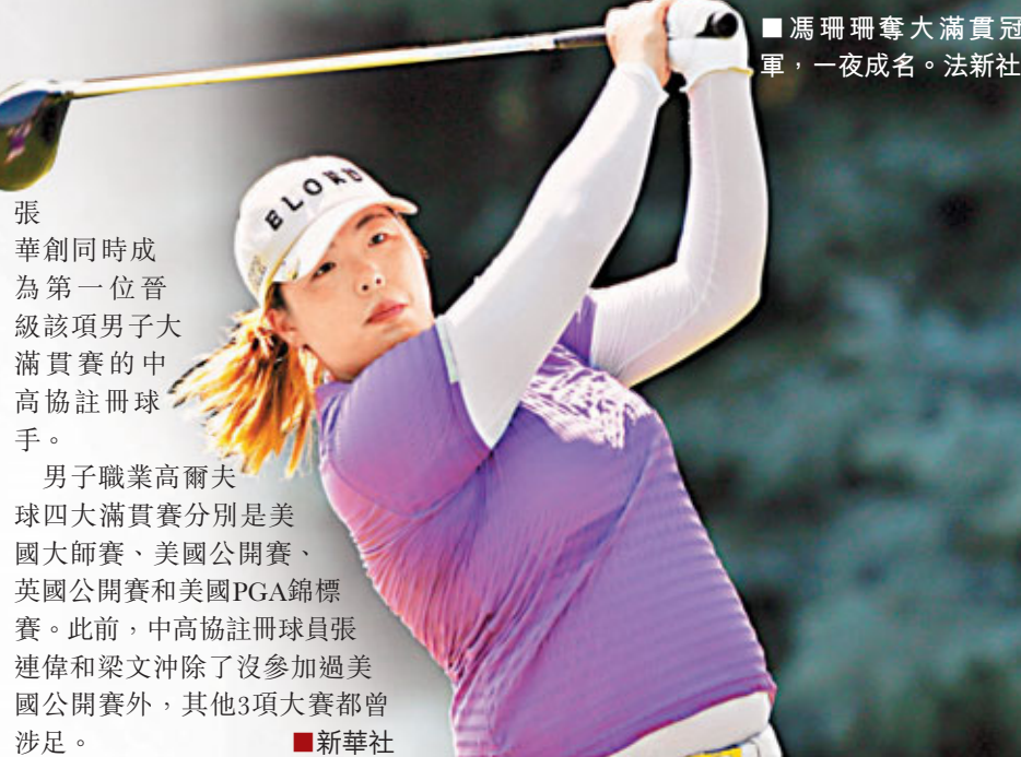
馮珊珊奪大滿貫冠軍，一夜成名。

第二的美國名將劉易斯高出8.57分。 排名本期第三和第四的分別是韓國好手崔羅蓮和挪威名將蘇珊。 排名第五的馮珊珊目前的平均分落後曾雅妮9.15分，不過與第四位的蘇珊僅相差0.03分，比第三位的崔羅蓮少0.16分。 11日，來自中國北京的14歲男孩張華創再為中國高爾夫球運動創造新紀錄：由於已獲得正賽資格的兩名選手因傷退賽，14歲5個月又21天的張華創有幸以替補身份進入正賽參賽陣容，從而改寫了15歲5個月又7天的美籍日裔球手藤川保持的美國公開賽史上最年輕參賽選手紀錄。