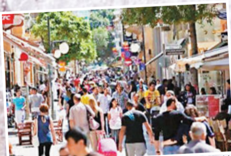
塞國銀行稱未見異常提款情況。圖為首都尼科西亞。

繼希臘、愛爾蘭、葡萄牙和西班牙後，塞浦路斯財政部長希亞爾利表示，可能會向歐盟申請援助金，以協助國內銀行資本重組，反映歐債危機仍在擴散。歐盟官員估計，對塞浦路