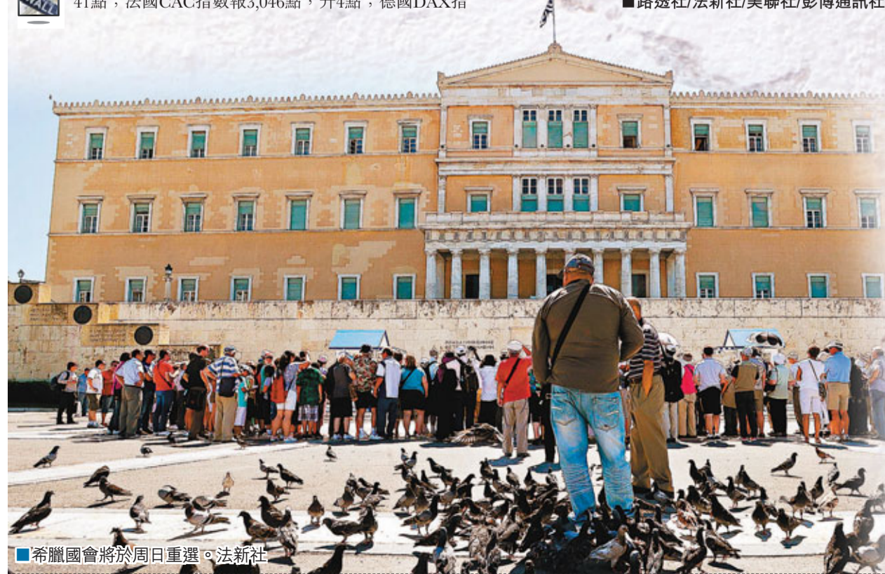
希臘國會將於周日重選。法新社

降兩級至「BBB+」，展望負面；降級主因是配合上周西國長期主權信貸評級下調，以及西國衰退可能持續至明年，同日再將另外18家西銀降級。 ■路透社/法新社/彭博通訊社/《紐約時報》