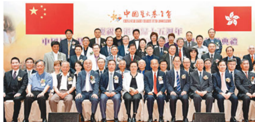
■星火基金會成立16周年暨就職禮賓主合照。

香港文匯報訊 中國星火基金會為慶祝成立16年，並舉行第六屆就職典禮，「慶祝香港回歸15周年」中國星火基金會成立16周年暨第六屆理事會就職典禮 慈善籌款晚會，日前假九龍尖沙咀龍堡酒店舉行。