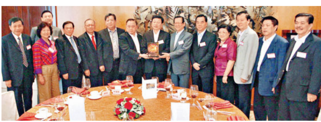
■香港僑界社團聯合會會長向馬儒沛等一行致送紀念品。

香港文匯報訊(記者 陳巧顏)香港僑界社團聯合會10日假跑馬地香港賽馬會會所百年廳，隆重設宴歡迎國務院僑辦副主任馬儒沛一行。馬儒沛專行訪港，特別慰問和感謝長期熱心內地公益慈善事業的僑界新舊朋友，借此加深雙方了解，溝通訊息，交流意見，加強友誼和聯繫。