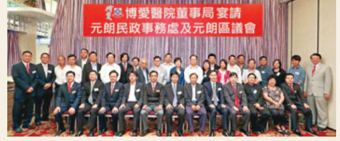
■博愛董事局成員與元朗民政處及區議會代表合照。