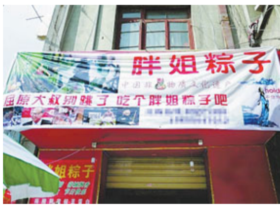
調侃屈原的粽子廣告。

「這句廣告詞的效果好得很哦!」胖姐笑著說,自從在店前掛上這條橫幅後,吸引到不少路人的注意,光是9日一天就賣了1000多元的粽子,比去年同期好。有網友將這條廣告橫幅拍照發上了微博,引發了網友熱議。網友白菓菓稱讚說:「好幽默啊!好奇他的粽子到底有多好吃?」同時,也有人覺得這句話不太尊重屈原,網友Ioa_oa說:「一個粽