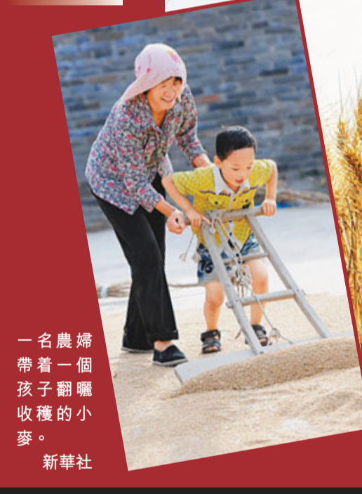
一名農婦帶著一個孩子翻曬收穫的小麥。