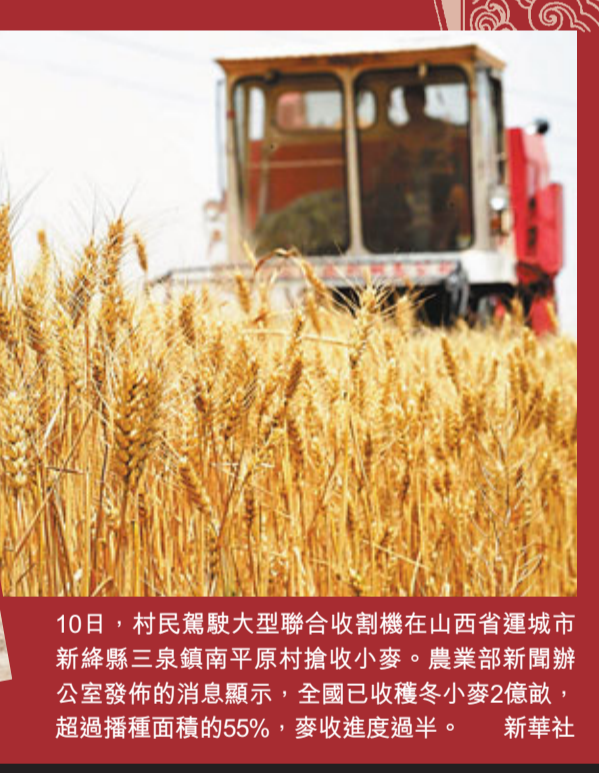
10日,村民駕駛大型聯合收割機在山西省運城市新絳縣三泉鎮南平原村搶收小麥。農業部新聞辦公室發佈的消息顯示,全國已收穫冬小麥2億畝,超過播種面積的55%,麥收進度過半。