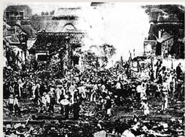
這場大火燒毀長沙市區房屋5萬多棟,居民死傷2萬餘人。

這場大火燒了幾天幾夜,燒毀長沙市區房屋5萬多棟,居民死傷2萬餘人,而敵人此時還在200公里以外!