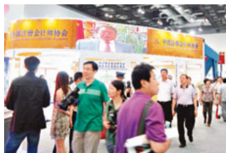
中國註冊會計師協會成果展。

香港文匯報訊 2012年度的中國註冊會計師全國統一考試香港考區報名工作將由今日開始。受國家財政部註冊會計師考試委員會委託，中國註冊會計師協會會員服務有限公司(簡稱「中註協駐香港聯絡處」)負責組織香港區考生報名和考試事務工作，中註協駐香港聯絡處由6月11日至6月25日接受香港考生報名，資格確認工作於7月6日結束。