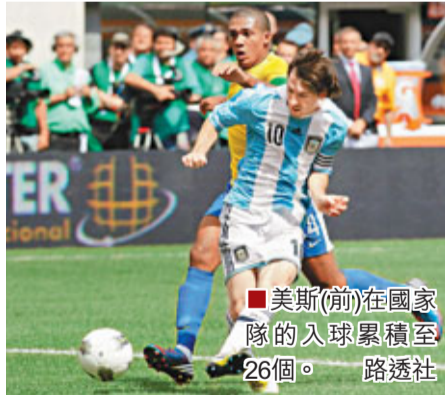
■美斯(前)在國家隊的入球累積至26個。

美斯賽後說:「雖然這是一場友賽,但能夠擊敗巴西永遠都是一件妙事,同時我非常高興取得3個入球,阿根廷對巴西出現7個入球並不常見。」美斯目前在阿根廷國家隊的入球累積為26球,超越前輩阿爾蒂塔升上史上第4位,僅落後巴蒂斯圖達、基斯普和馬拉當拿,而美斯的入球數字只比第3位的馬拉當拿少8個。 ■香港文匯報記者 蔡明亮