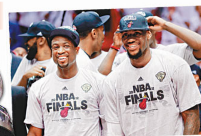
■保殊高舉東岸冠軍獎盃。