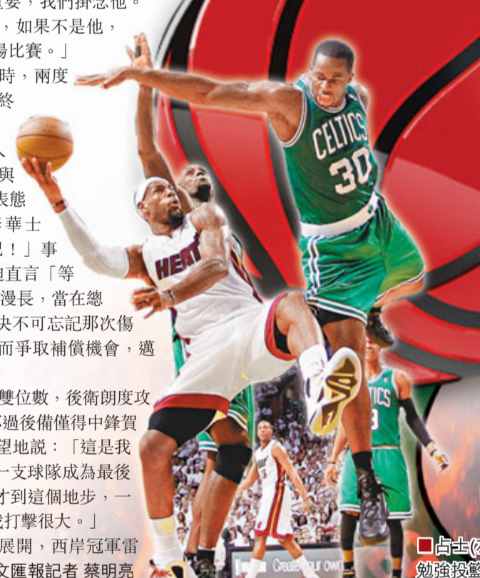
■占士(左)在巴斯封阻下勉強投籃。

NBA總決賽將於美國時間周二展開,西岸冠軍雷霆將擁有主場之利。 ■香港文匯報記者 蔡明亮