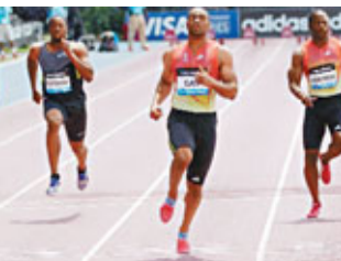
■香港文匯報記者 蔡明亮

壞。我的成績並不差,但我總是擔心臀部的傷勢。回歸的感覺很好,我很緊張,但我很滿意成績;我感覺不到疼痛,我的身體狀況越來越好,在選拔賽前,我還有幾周時間可以好好準備。」基爾將於本月底參加美國的奧運選拔賽。 ■香港文匯報記者 蔡明亮