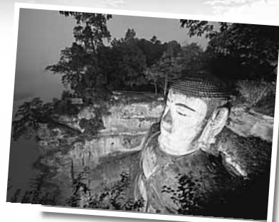
樂山大佛之夜

參觀四川旅遊(香港)大型攝影圖片展優惠多多。憑本報可在展覽現場領取精美紀念品，每天限量500份。還有更大優惠！持三張參觀券到現場蓋章，即可參加港中旅組織的「乘香港航空——百個家庭優惠遊四川」的活動，一個家庭（三人行）可優惠1000元。