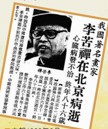
我國著名畫家李苦禪在北京病逝。

在花鳥大寫意畫方面獨樹一幟。他的畫筆墨雄闊、氣勢磅礴、自成風貌。李苦禪常言：「字畫如其人，藝術及人品之體現，人無品格，行之不遠，畫無品格，下筆無方。」儘管命運多舛，備歷艱辛，李苦禪始終以鏗而不捨的精神，執藝不輟。曾為人民大會堂作巨幅《盛夏圖》，又作巨幅《松鷹圖》，以象徵祖國之未來。其傳世作品有《盛荷》《群鷹圖》《蘭竹》《芙蓉》《秋節風味》等。