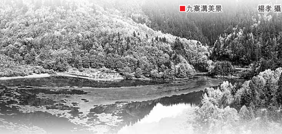
九寨溝美景

東方之珠獻大愛，熊貓故鄉感深情——6月13日到17日，「四川最美的地方」大型旅遊攝影圖片展期待您的光臨。