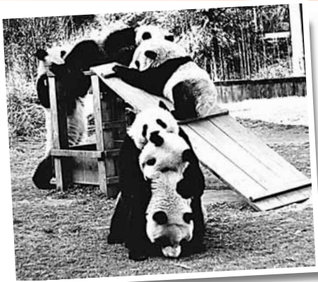
大熊貓墨羅漢

在「大愛四川——災後重建 輝煌崛起」主題中，香港市民將全面了解到北川、雅安、廣元等地的災後新貌。「大美四川——大山大水 大象無形」主題，將讓香港市民與峨眉山、樂山大佛、青城山、貢嘎山等美麗絕倫的四川自然風光來一次深入接觸。如果對巴蜀大地、天府之國的歷史和文化感興趣，那麼「人文四川——千年古蜀人傑地靈」中展示的杜甫草堂、三蘇祠、文殊院等人文景點絕對不能錯過。到四川旅遊，美食、美酒、美人一個都不能少，