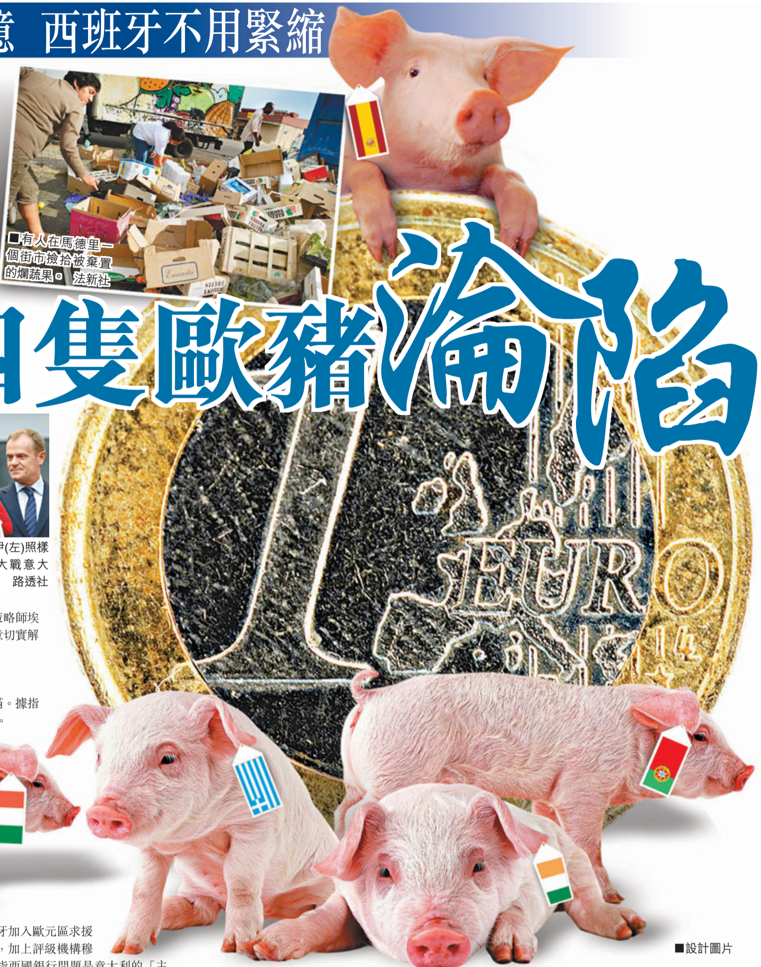
有人在馬德里一個街市撿拾被棄置的爛蔬果。法新社

德國上月新車登記下跌4.8%；4月工業訂單跌1.9%，跌幅較預期大；同期進出口分別跌4.8%及1.7%；ZEW經濟景氣指數和IFO商業景氣指數亦變差。分析擔心德國經濟已脫離健康期。分析認為，進口同樣大幅下跌，顯示本土經濟已出現問題，第2、3季經濟或因此收縮。 ■法新社