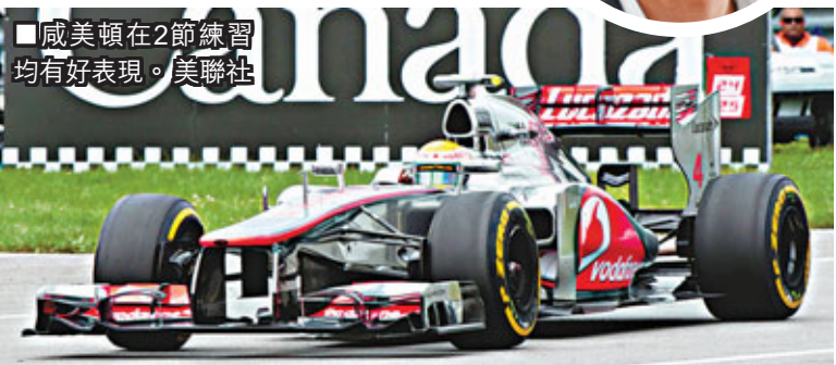
威美頓在2節練習賽中均有良好表現。