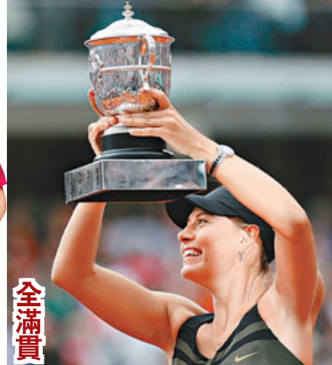
全滿貫 ■俄羅斯球手舒拉寶娃昨日在法網女單決賽，只需1小時29分鐘，便以6:3和6:2的盤數輕取意大利球手艾蘭妮，首次奪冠，並成為史上第10名取得「全滿貫」成就的女網球手。