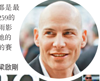
威美頓在2節練習賽中均有良好表現。