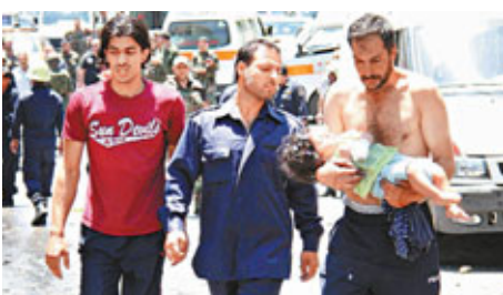
■大馬士革近郊發生汽車炸彈襲擊，有父親抱着受傷幼女。 路透社

本有160人居住的村中毫無人煙，觀察員無法與證人談話。但內希爾基指，有鄰村民前來訴說所聞。古沙說，居民所述資訊有點矛盾，須比對並核對居民口中被殺和失蹤者的名字。 ■美聯社/法新社/路透社