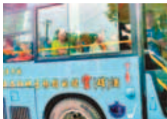
公交车上的「要喝就喝提官（罐）酒」廣告語。

訊（記者 陳靜、朱娟 洛陽報導）近日，在河南洛陽市街頭，一輛在公交车身上的廣告語「要喝就喝提官（罐）酒」、「洛陽地區暢銷的提官（罐）酒」