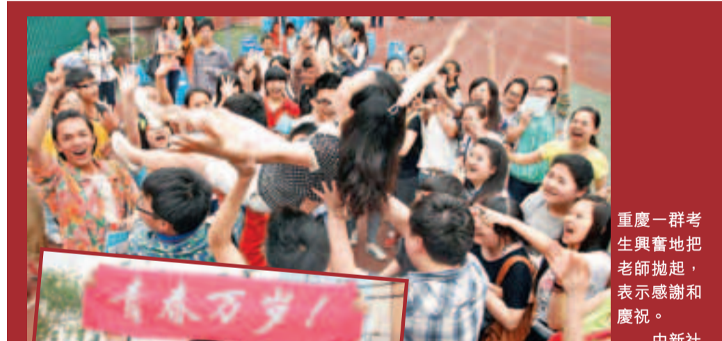
重慶一群考生興奮地把老師拋起，表示感謝和慶祝。

洛陽市工商經檢支隊一名執法人員則表示，該白酒的宣傳語涉嫌違反《酒類廣告管理辦法》第七條之規定：酒類廣告中不得出現「把個人、商業、社會、體育、性生活或者其他方面的成功歸因於飲酒的明示或者暗示」的內容。