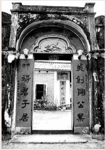
位於海南文昌的鄭庭笈故居。

1961年2月，鄭庭笈將軍在紅星公社勞動1年後，全國政協任命他與傅儀、杜聿明、宋希濂、王耀武、周振強、楊伯濤等7人為文史專員，周總理叮囑他們將親身經歷及見聞寫出來。