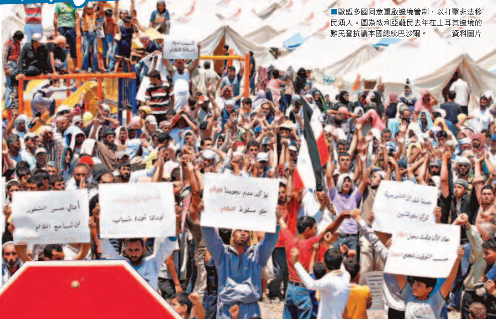
■歐盟多國同意重啟邊境管制，以打擊非法移民湧入。圖為敘利亞難民去年在土耳其邊境的難民營抗議本國總統巴沙爾。