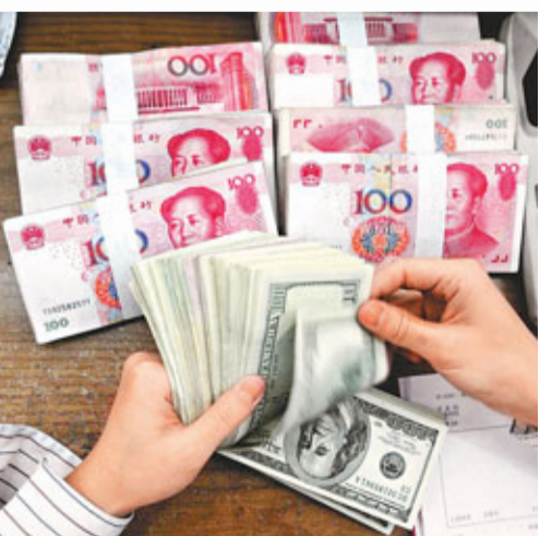
聯儲高官費希爾擔心，人幣終有一天會取代美元。