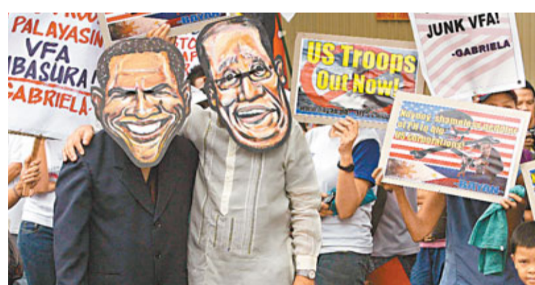
8日,大批菲律賓民眾在馬尼拉上街示威,抗議阿基諾三世訪美、尋求加強菲美軍事聯繫。

從5日開始,帕內塔還對印度進行為期兩天的訪問。期間,他宣稱,美國將讓印度買到美國最先進的武器技術,並承諾與印度共同研發武器裝備。印度與美國強化軍事合作,不少外媒都聯想到了中國。英國媒體稱,印度之所以急於花大錢買武器、研發武器,很大程度上就是因為「抗衡中國」。