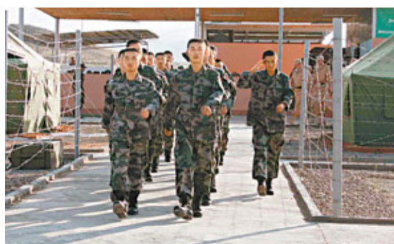
中國軍人在上合組織聯合反恐軍事演習野營村內列隊行進。

據悉,中方參演官兵爲1個摩步連,1個炮兵班共369人。俄國防部新聞局日前透露,上海合作組織「和平使命-2012」聯合反恐演習將持續8天,分三個階段組織實施。預計6月14日演習結束。第一階段:進行軍政磋商,研判危機局勢、作出戰略決策,該階段在塔吉克斯坦胡占德市舉行;第二階段:山區聯合反恐行動準備;第三階段:動用實兵實施聯合反恐行