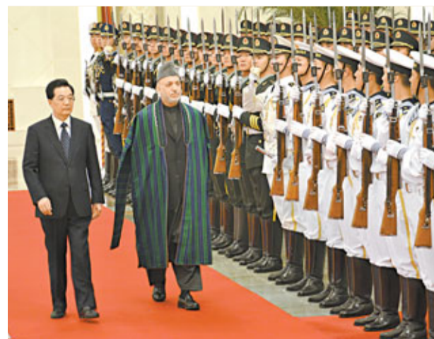
胡錦濤為來華訪問的阿富汗總統卡爾扎伊(右)舉行歡迎儀式。

香港文匯報訊(記者 葛沖 北京報導)昨日上午,國家主席胡錦濤在人民大會堂同來華訪問的阿富汗總統卡爾扎伊舉行會談。雙方就加強反恐合作等諸多方面達成廣泛共識,並決定建立戰略合作夥伴關係。