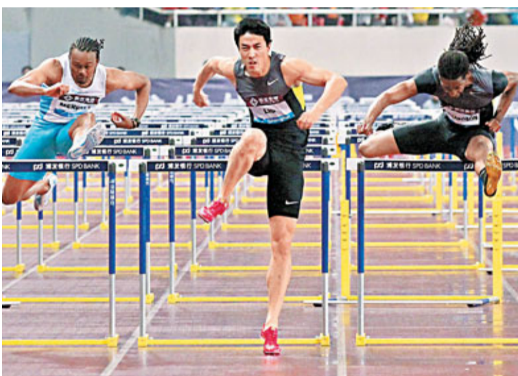
■ 劉翔(中)重返世界第一。