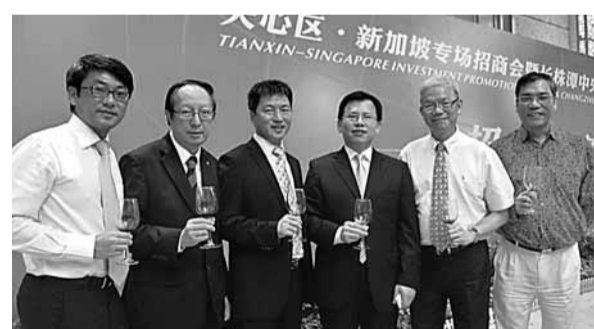
■長沙市天心區新加坡專場招商推介會吸引了眾多外商參與

長沙市天心區新加坡專場招商推介會於5月19日舉行，重點推介天心區「長株潭中央商務休閒區(CED)」，新加坡中國商會成員企業及北京華遠地產等百餘家國內外知名企業負責人參會洽談。本次招商推介會以面向新加坡中國商會成員企業為主