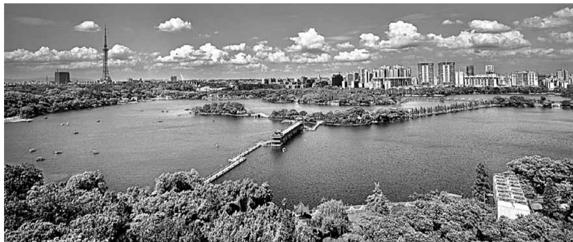
■近年來，長沙一直致力於生態宜居城市的建設，全市生態環境得到了顯著改善。

此外，為實現經濟可持續快速發展，近年來長沙堅持走新型工業化道路，以環境保護為導向，以可持續發展為目標，致力於從粗放增長到集約發展、從數量增加到質量提升、從外延擴張到內涵拓展、從依賴資本增加向依靠技術進步的轉變，通過集約節約利用土地、節約能源資源，提高科學技術對社會經濟發展的貢獻率，倡導發展節約型循環經濟，大力培育形成了科技含量高、創新能力強、資源消耗低、發展後勁足的極具競爭力的產業結構。