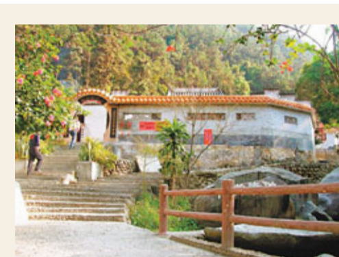
■龍山塘村旅遊景區帶動當地經濟。