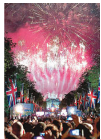
演唱會尾聲時，白金漢宮發放璀璨煙花。