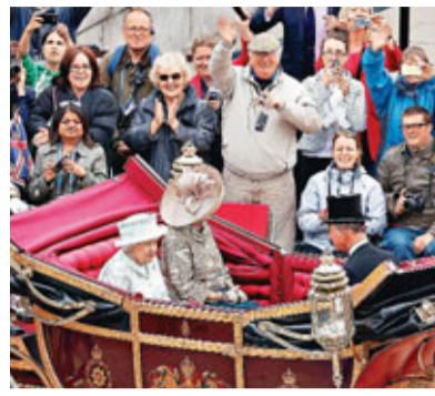
女王(左前)坐馬車接受民眾道賀。

美國總統奧巴馬昨在白宮網站上載一段私人影片向英女王致意，他片中讚揚女王是英美長久以來特殊關係的「活見證」。