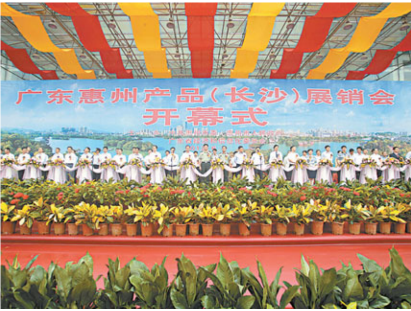
■ 廣東惠州產品（長沙）展銷會隆重開幕

據悉，此次展銷會以「惠州製造，名品展銷」為主題，展位面積近1.2萬平方米，參展企業有國有、民營、港澳台商企業和外商投資企業共230家。「惠貨全國行」前9場展銷會共簽訂銷售合同2471宗，總金額1607.18億元。 湖南省軍區司令員張永大，湖南省委常委、省軍區政委李有新，湖南省