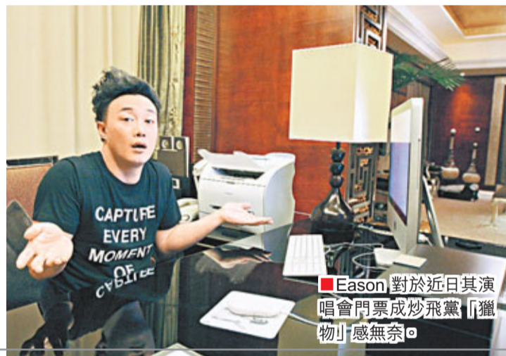
Eason對於近日其演唱會門票炒飛黨「獵物」感無奈。