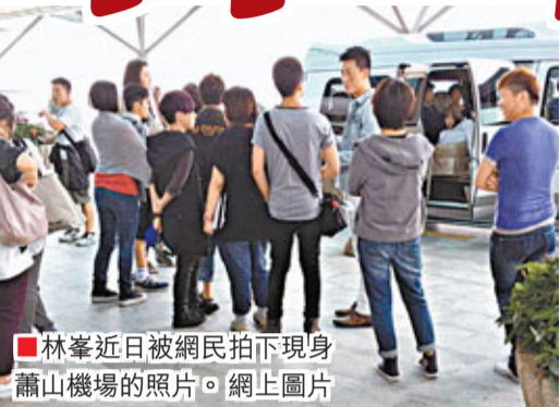
林峯近日被網民拍下現身蕭山機場的照片。

貴為無綫親生仔，林峯近年已經減少拍劇，頂多是一年拍一部公司劇，然後主力轉攻電影及演唱會。09年起已經連續3年的暑假在紅館舉行個人演唱會，打破香港新世紀歌手在紅館連開個唱紀錄。不少歌迷引頸以待，都在網上留言問林峯是否7月再接再厲開騷。