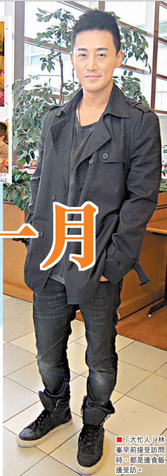
「大忙人」林峯早前接受訪問時，都是邊食飯邊受訪。