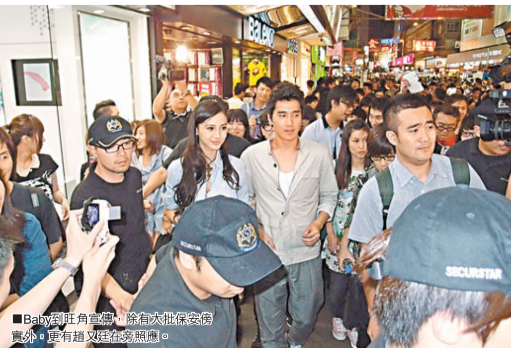
Baby到旺角宣傳，除有大批保安傍實外，更有趙又廷在旁照應。