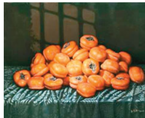
■吳家禮作品《收穫系列》No.15