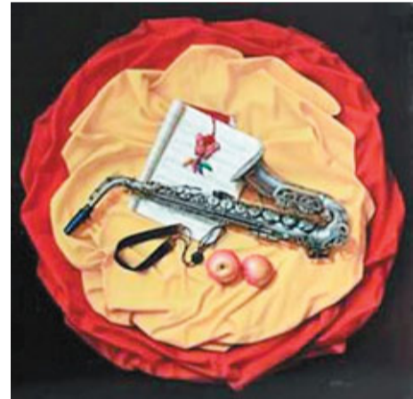
■吳家禮作品《襯布上的薩克斯》