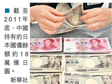
截至2011年底,中國持有的日本國債餘額約18萬億日圓。

報道指出,今年3月,日本宣佈獲准最多可購入650億元人民幣中國國債;6月1日起,人民幣和日元實現直接交易。分析人士認為,隨着中日財金合作關係的加深,雙方可能進一步增加互持國債的比重。