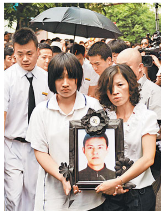
昨日,杭州「英雄司機」吳斌出殯。圖為其家屬捧着吳斌遺照走在出殯隊伍前面。