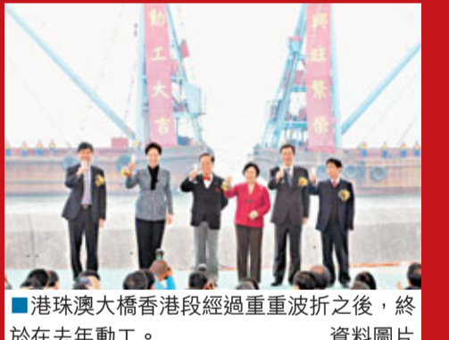
港珠澳大橋香港段經過重重波折之後，終於在去年動工。