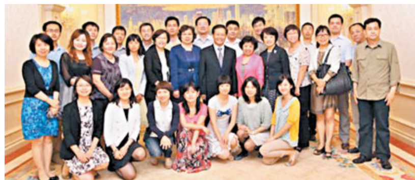
彭清華在採訪結束後與採訪團成員合照。

彭清華最後表示，慶祝香港回歸祖國15周年，是今年國家和香港的大事、喜事。目前，中聯辦正在配合特區政府做好有關慶典活動的籌備工作，香港社會各界也在積極組織豐富多彩的群眾性慶祝活動。相信這些慶祝活動，將進一步彰顯「一國兩制」實踐的光輝成就，激發港人的愛國愛港情懷，推動「一國兩制」偉大事業不斷邁向前進。