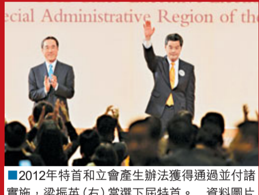
2012年特首和立會產生辦法獲得通過並付諸實施，梁振英(右)當選下屆特首。