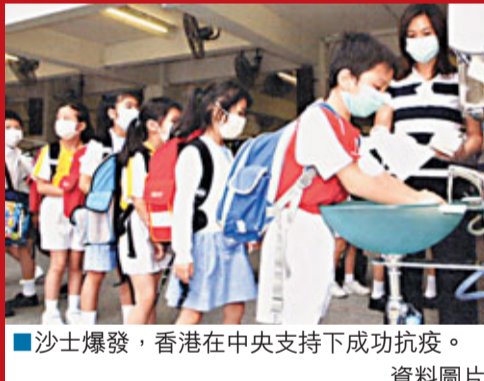
沙士爆發，香港在中央支持下成功抗疫。

香港文匯報訊(記者 鄭治祖)自2003年香港與內地簽署CEPA後，一個互惠雙贏的經貿平台正式建立，為香港和內地的經濟發展作出重大的貢獻。在貨物貿易方面，至2012年，共有1,730多種的香港原產地貨品可以享有零關稅的優惠，累積批出的港產貨品出口總值超過403億元，關稅優惠28.3億元人民幣(約34.6億港幣)。 在服務貿易方面，目前橫跨47個服務領域共301項的開放措施和多個領域的投資便利化措施，為香港的傳統支柱行業提供了更大的發展空間，促進優勢產業的發展，令香港的經濟基礎更加穩固，並進一步提升香港作為區域物流樞紐和國際金融中心的地位。