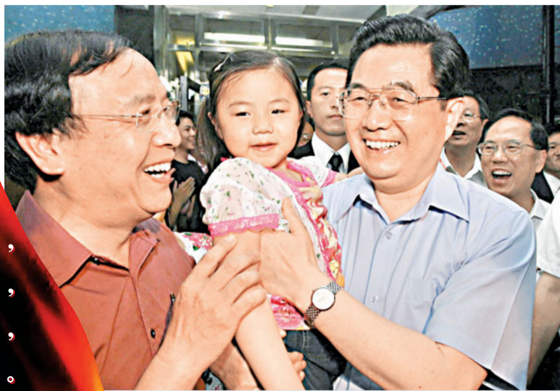
胡錦濤在香港回歸10周年時到馬鞍山錦豐苑看望居民。

胡總勉港： 集中精力發展經濟， 切實有效改善民生， 循序漸進推進民主， 包容共濟促進和諧。