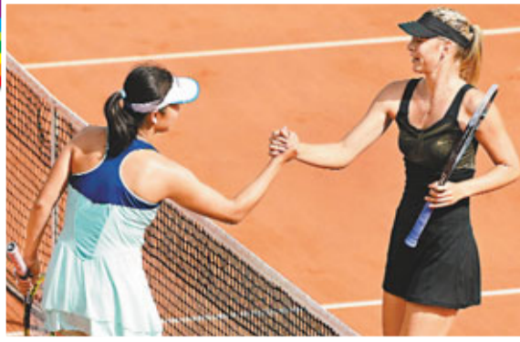
舒娃與彭帥於賽後禮貌地握手。