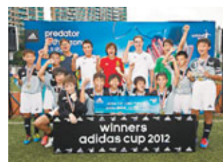
香港少聯足球隊在adidas cup 2012中奪冠。

《adidas Cup 2012》U13組別昨日在京士柏運動場隆重上演，港少聯(見圖)成功過五關斬六將，在冠軍戰憑小將廖智謙一箭定江山，以1：0險勝車路士足球學校A，成為