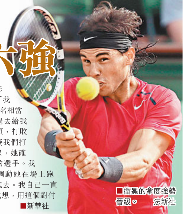
衛冕的拿度強勢晉級。