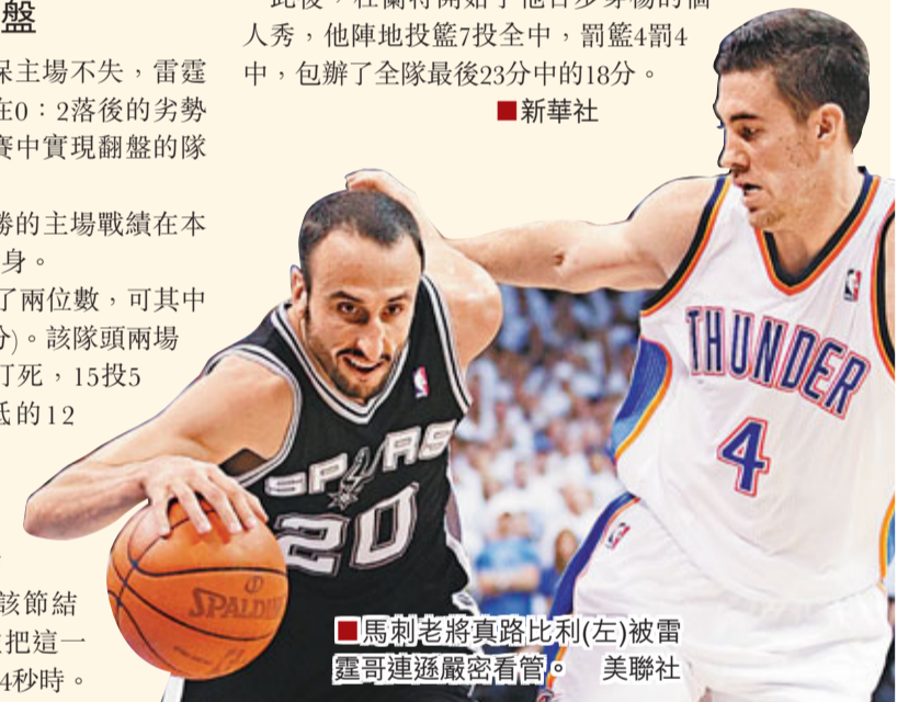
馬刺老將真路比利(左)被雷霆哥連遜嚴密看管。