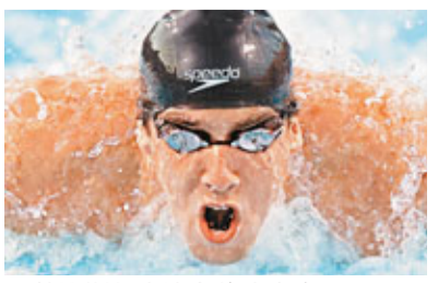
菲比斯仍未決定倫奧參賽項目。