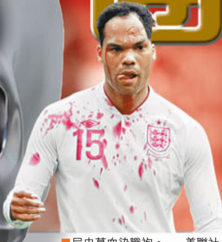
■尼史葛血染戰袍。