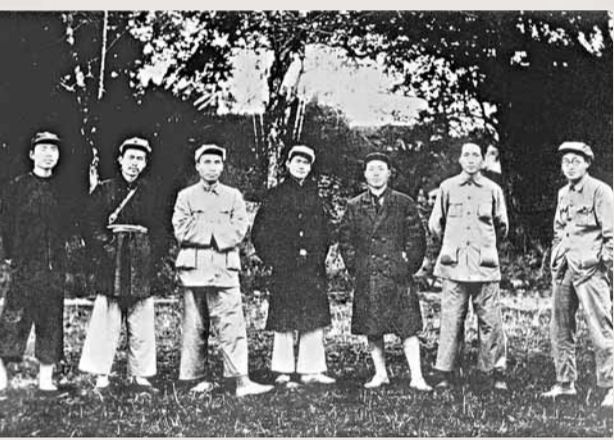
■中共蘇區中央局合影，右二為毛澤東。