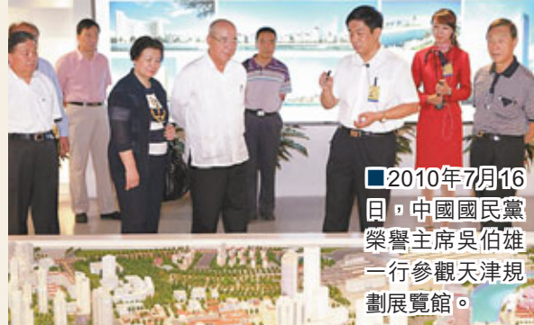
■2010年7月16日，中國國民黨榮譽主席吳伯雄一行參觀天津規劃展覽館。

「雙城雙港、相向拓展、一軸兩帶、南北生態」，是天津確定的空間發展戰略。其中，「雙城」是指中心城區和濱海新區核心區，是天津城市功能的兩大核心載體；「雙港」是指天津港的北港區和南港區，「雙港」同步建設將使天津的港口優勢成倍擴大；「一軸」是指從北京方向延伸至濱海的軸線，借助毗鄰首都的優勢，貫通津濱「雙城」，形成綜合發展長廊；「兩帶」分別為西部城鎮和東部濱海兩條發展帶，一東一西，遙相呼應；「南北生態」是指從南到北的三大生態建設和保護片區，是天津建設生態城市的重要載體。