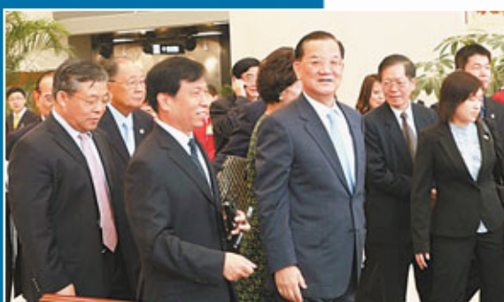
■2009年7月29日，中國國民黨榮譽主席連戰一行參觀天津規劃展覽館。