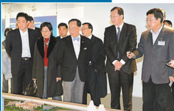
■2009年3月4日，香港特首曾蔭權(左三)一行由天津市副市長任學峰(左四)陪同參觀天津規劃展覽館。