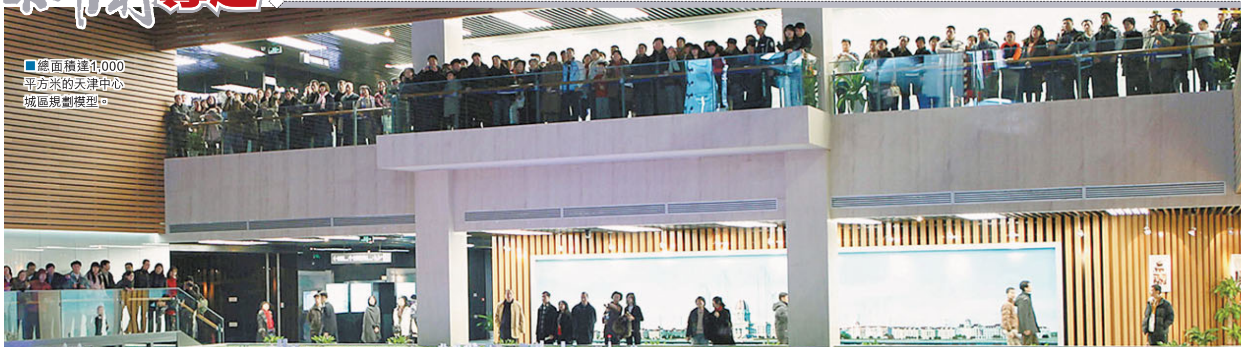
■總面積達1,000平方米的天津中心城區規劃模型。