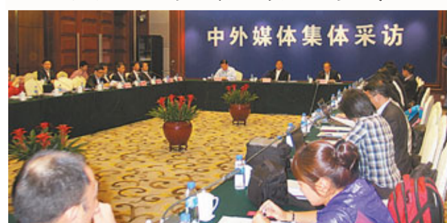
中外媒體赴貴州採訪活動記者見面會。