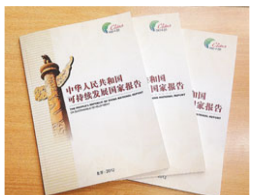
在2012年聯合國可持續發展大會召開前，中國率先發布可持續發展國家報告，明確提出今後的戰略舉措。